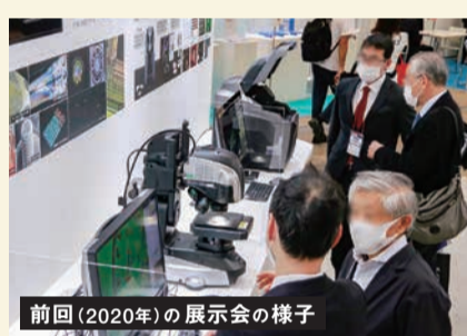
前回(2020年)の展示会の様子